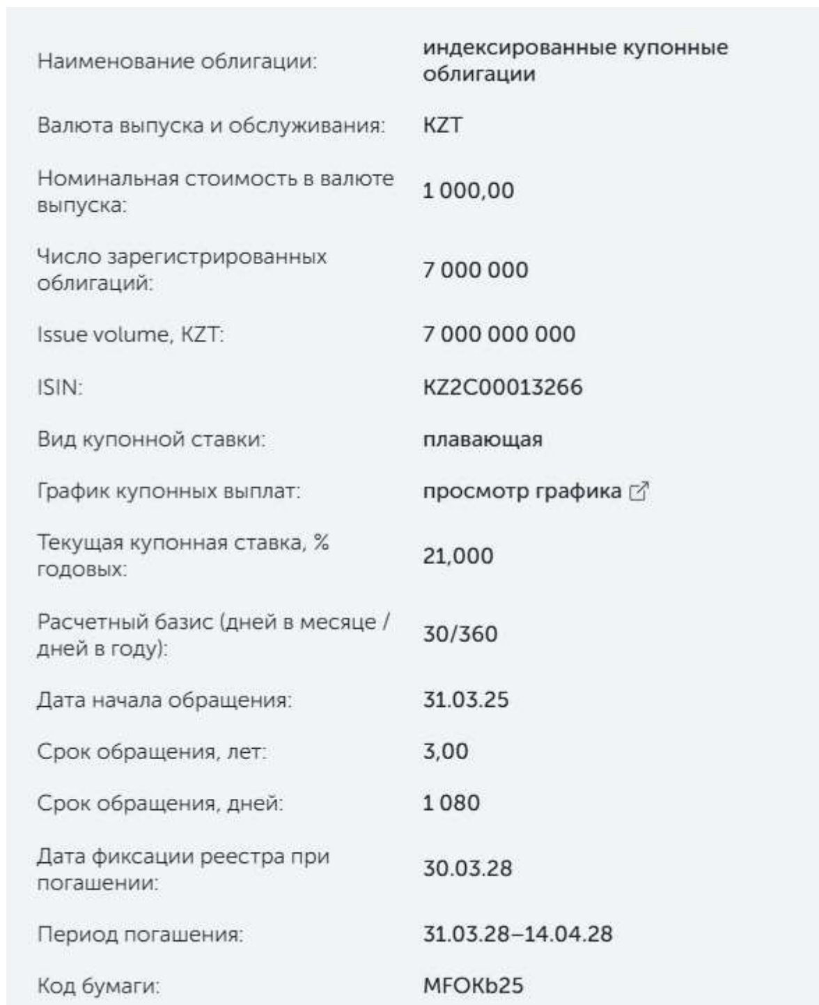
Рисунок 1. Облигация KZ2C00013266

https://kase.kz/ru/investors/bonds/MFOKb25